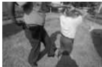
Sujetar los dedos del intervenido da mayor seguridad al procedimiento.