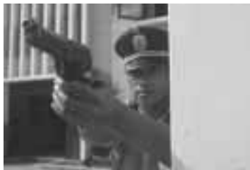
La posición ideal para el disparo no existe.

La sujeción del arma es la base de un disparo seguro