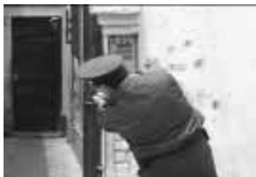
El movimiento es lento y coordinado, primero avanza la cabeza y parte del tórax.