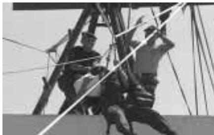
Todas las personas deben recibir por igual, atención de la policía.