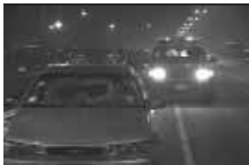
Aprovechar los dispositivos luminosos en las Intervenciones Nocturnas