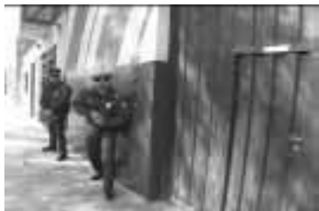
La ubicación de los policías debe ser segura.