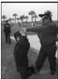
El contacto visual y la verbalización son permanentes