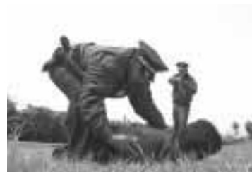
El registro debe ser minucioso