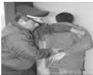
Controlar al Intervenido sujetándola fuertemente

permitir que el intervenido se concentre en planificar una respuesta violenta contra la acción del policía de contacto.