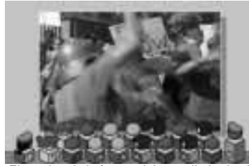
El empleo de la fuerza debe ser limitado al máximo.