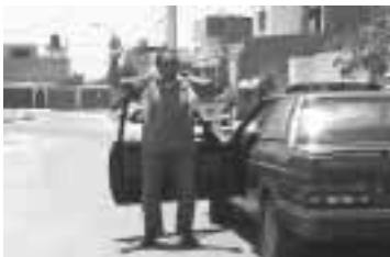
Aleje al conductor del vehículo.