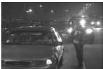
Las intervenciones nocturnas requieren empleo de linternas.

Efectuado el registro ocular, le indica que se dirija hacia el patrullero; una vez que el intervenido está por traspasar el campo luminoso de los faros, procederá a alumbrar con su linterna o faro hacia la cara y manos de éste hasta llevarlo a la parte posterior del patrullero, continuando con el procedimiento indicado.