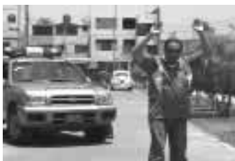
Efectuar un registro visual del intervenido.