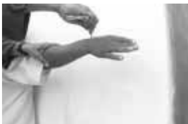
Para colocar el grillete es necesario presionar no golpear.