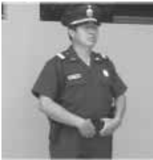
Posición de entrevista