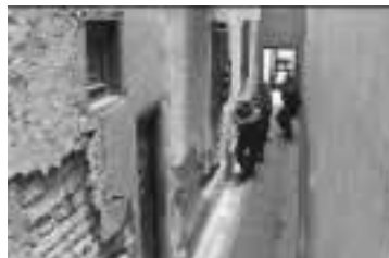
Los pasadizos son áreas de riesgo.

Son considerados áreas de riesgo. Pueden ser usados para dos fines: