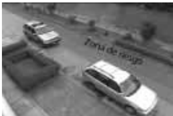
El vehículo policial siempre debe estar detrás del vehículo intervenido