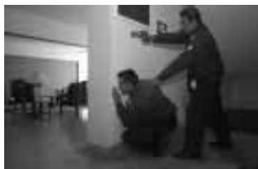
Es necesario adoptar una posición cómoda y segura