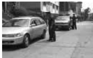
La cobertura y la seguridad. constituyen las bases de la intervención a vehículos.