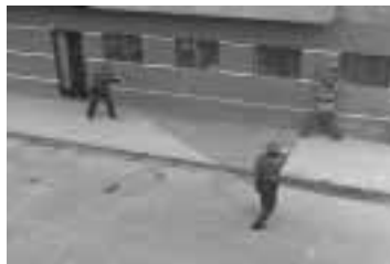
Toda intervención policial deben efectuarla dos efectivos policiales como mínimo.

En caso que la intervención sea ejecutada por dos efectivos a pie, éstos deben formar en lo posible un cono de seguridad, en cuya base deben ubicarse los policías interventores, y en el vértice o punto medio proyectado del cono el presunto infractor.