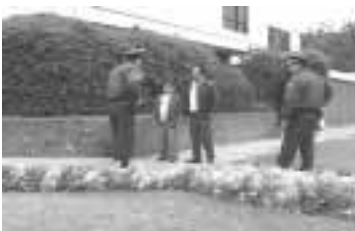
Siempre debemos estar atentos a una posible reacción del intervenido