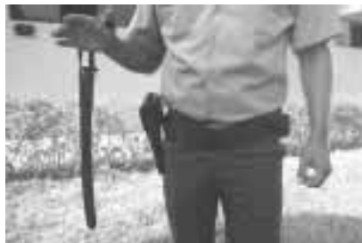
La vara de goma es un equipamiento indispensable para el efectivo policial uniformado.

La vara de goma es parte del equipo básico empleado por los miembros de la Policía Nacional del Perú. Está hecha de goma, revestida de cuero, de unos 3 cm de diámetro y aproximadamente 50 cm de largo; el revestimiento de cuero tiene un doblez que sirve como costura, desde la punta hasta la base de unión en la parte posterior, que es rematado en un anillo de cuero de aproximadamente 4 cm de diámetro, que a la vez sirve de tope al empuñarla. A unos 15 cm aproximadamente del extremo superior de la vara, se encuentran cuatro remaches que sujetan una presilla de cuero, la cual sirve para pasar la mano debiendo ser regulada de acuerdo a la necesidad de cada efectivo policial.