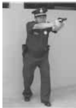
Posición de potencial de disparo

Después de disparar, el efectivo policial deberá verificar que no existan otras amenazas, y adoptará la posición de alerta (3), evaluando su zona de responsabilidad ante posibles amenazas adicionales.