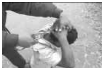
Sujetar los dedos permite asegurar las manos del intervenidos