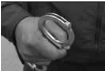
Los grilletes listos facilitan su uso