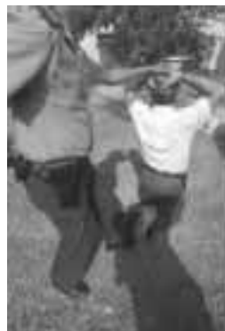
Colocar los pies entre los del infractor permite una posición más segura.