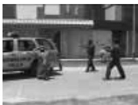
Coloque al intervenido en la posición mas adecuada.