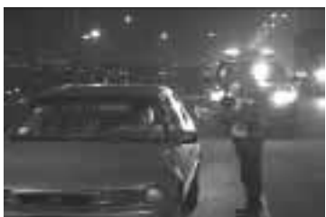
Las linternas al ser utilizadas deben permitir observar adecuadamente.

Efectuado el registro ocular, le indica que se dirija hacia el patrullero; una vez que el intervenido está por traspasar el campo luminoso de los faros, procederá a alumbrar con su linterna o faro hacia la cara y manos de éste hasta llevarlo a la parte posterior del patrullero, continuando con el procedimiento indicado.