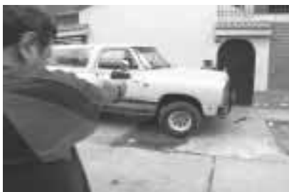
El uso del arma es excepcional solo se utiliza en defensa de la vida.

¡ARROJE EL ARMA! o ¡SUELTE EL ARMA! ¡NO SE MUEVA! o ¡NO INTENTE REACCIONAR, ESTAMOS ARMADOS PODEMOS DISPARAR!