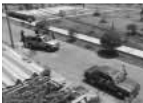
El intervenido debe ser colocado cerca al vehículo policial, facilitando su control.