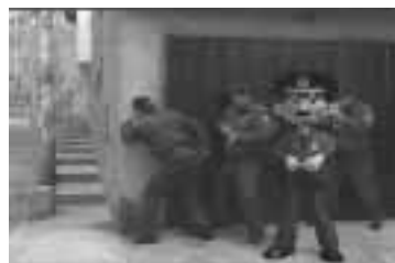
La información obtenida debe ser verificada.

Debe ser realizado por dos policías como mínimo o un grupo de policías, los cuales deberán dividirse en parejas para poder hacer la intervención ambiente por ambiente. Es importante considerar previamente: