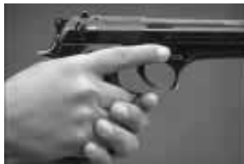
Al desplazarse hágalo con el dedo fuera del gatillo