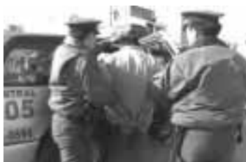
La conducción de un sospechoso arrestado debe ser siempre segura

También deberán ser esposados los intervenidos que se encuentren bajo el influjo de drogas, alcohol o cualquier estado emocional alterado que represente peligrosidad para sí mismo o para otros.