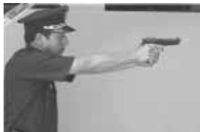
Evalúa la situación antes de enfundar el arma

La posición que debe adoptar el efectivo policial responde a la evolución del riesgo que se enfrente, no necesariamente debe seguir la secuencia descrita. Asimismo, el arma nunca se enfunda sin hacer una verificación primero en la posición preventiva, con la finalidad de comprobar que el arma esté asegurada (puede ser al seguro o despejando munición de la recámara); esto también refuerza la evaluación de la situación que se enfrenta antes de enfundar definitivamente el arma.