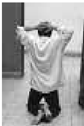
Esta posición es recomendable para espacios abiertos.