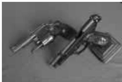
Las armas al guardarse deben evidenciar que están sin munición