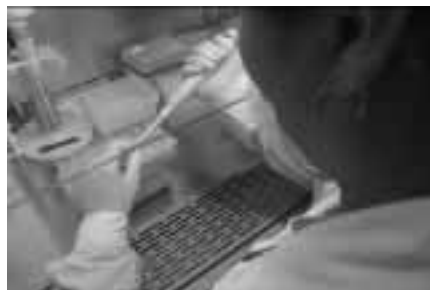
Las investigaciones policiales buscan llegar a la verdad de los hechos.

La Policía Nacional del Perú es una institución del Estado, creada para garantizar el orden interno, el libre ejercicio de los derechos fundamentales de las personas y el normal desarrollo de sus actividades ciudadanas. Sus funciones se encuentran establecidas en la Ley N° 27238 y su reglamento, así como en otras leyes especiales, las cuales desarrollan la finalidad fundamental establecida en el artículo 165 de la Constitución Política del Perú de 1993.