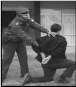
El infractor esposado es vulnerable a caerse por ello se debe ayudar sus movimientos.