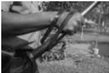
Empuñamiento en toma corta

personas demasiado cercanas, con poco espacio para utilizarla en extensión del brazo.