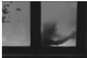
El cruce por la ventana debe ser seguro.