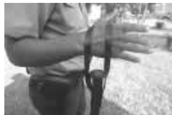
La correa de cuero debe ser utilizada por detrás de la mano

Es importante asegurarse que el doblez de la costura del forro de cuero quede siempre hacia la palma de la mano, evitando así lesiones innecesarias.