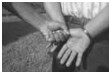
Se aleja las manos del intervenido de su cuerpo para facilitar el empleo de los grilletes