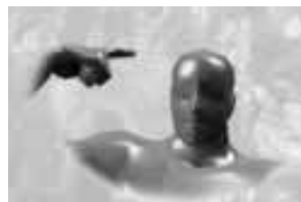
CONTROL DE EMOCIONES