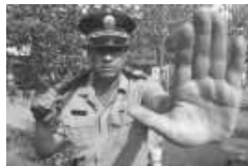
La importancia del brazo extendido para limitar la zona de riesgo