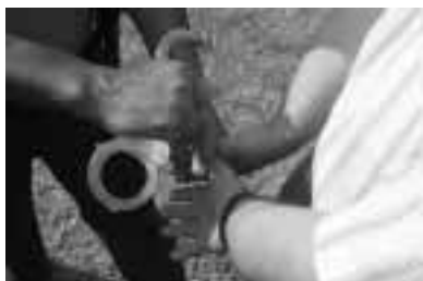
La mano fuerte sujeta firmemente los grilletes