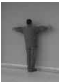
Posición del intervenido de pie