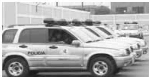
La actuación de la policía garantiza el respeto de las personas.

Para que las personas puedan disfrutar de sus derechos establecidos constitucionalmente, la Policía debe mantener el orden social, además de garantizar el libre ejercicio de éstos.