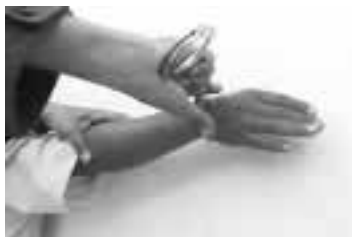
Colocado el grillete el giro del brazo es firme, sin soltar las manos del intervenido.