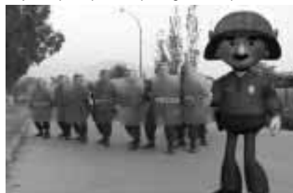
La apariencia de los efectivos policiales influye en la percepción de los manifestantes.