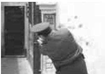
El avance se realiza siempre protegido y lentamente para evitar ser sorprendido.