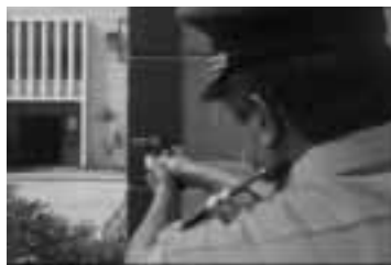
El arma debe apuntarse hacia los puntos de riesgo en forma permanente.