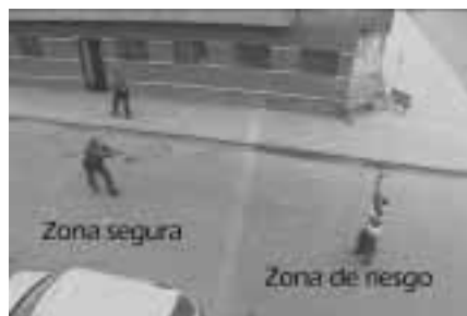
Delimitar la zona de intervención es imprescindible para garantizar su éxito.

Es el medio más utilizado en una intervención policial, cuya característica principal es tratar de imponer el principio de autoridad, a través del empleo enérgico de la expresión oral adecuada a cada situación particular; es importante enfatizar que la verbalización no es una conversación amical o coloquial, por el contrario, es una confrontación verbal para persuadir y vencer al infractor que deponga su ilícita actitud, sobre todo cuando se le priva de su libertad. Correctamente utilizada, minimiza los riesgos y maximiza los resultados de la intervención.