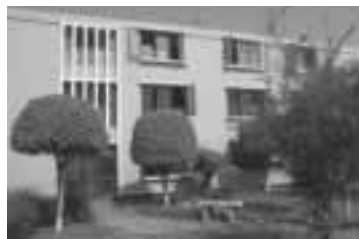
El reconocimiento del inmueble es imprescindible para la intervención.

ambientes interiores constituyen zonas de riesgo permanente, estas zonas son controladas y convertidas en áreas seguras una por una. Otro aspecto a considerar es el diseño y material empleado en su construcción, ello conlleva un trabajo profesional, altamente coordinado, donde prime la seguridad como norma básica y se la ejecute con sigilo, dinamismo, destreza y control emocional.