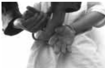
Se debe mantener los dedos de la mano libre sujetos hasta colocarle la esposa