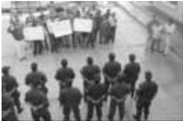
Una intervención oportuna minimiza la posibilidad de hechos violentos.