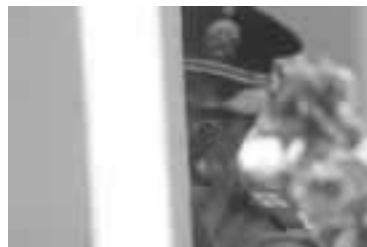
La imagen de tiro es necesaria para efectuar un disparo certero

a través del dedo pulgar estirado, cerrando alternadamente los ojos; el ojo dominante será aquel que permita visualizar el pulgar y el punto en una sola línea.