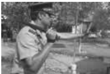
Empuñamiento en toma larga