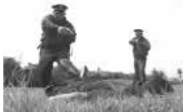
La ubicación de los policías garantiza cobertura permanente