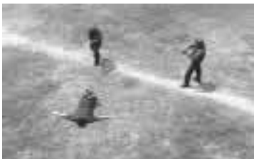
La posición tendido es la más segura ante una situación de riesgo.