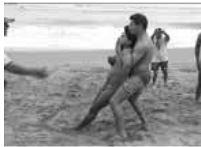
La policía presta auxilio a las personas y a la comunidad.

En sentido amplio, función policial es la actividad del Estado que regula y mantiene el equilibrio entre la existencia individual y el bien común; estableciendo restricciones y limitaciones a los derechos y libertades, y recurriendo a la coacción de ser necesario, para garantizar la convivencia social, en ejercicio de la ley.