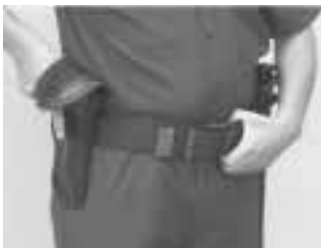
Posición de Contacto

La mano fuerte en la empuñadura de la pistola, el pulgar abre el botón del seguro de la funda, el índice extendido a lo largo de la parte exterior de la funda, los dedos restantes alrededor de la empuñadura de la pistola o revólver.