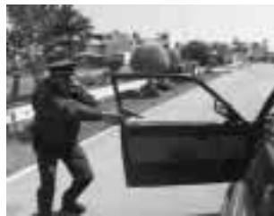
El registro vehicular inicial es por seguridad.