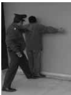
Es necesario colocar al sospechoso en desequilibrio.