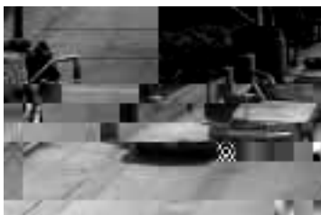
La cobertura y el estado de alerta son permanentes.