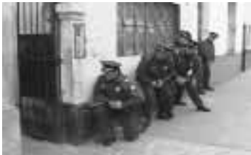
El cuerpo no debe pasar el nivel de la pared, puerta o ventana y la observación debe ser rápida