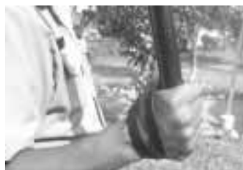
Empuñamiento adecuado de la vara de goma