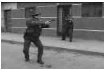
Los policías deben ubicarse sin cruzar sus líneas de tiro