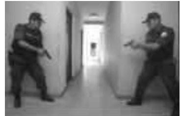
Es importante ubicarse totalmente fuera del marco de la puerta