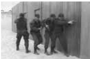
Identificar el nivel de amenaza, para emplear el nivel de fuerza adecuado