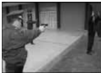
La identificación del personal siempre es necesaria.

un mayor nivel de riesgo para los efectivos policiales; pueden presentarse durante el patrullaje o a mérito de una comunicación radial o telefónica de la unidad policial. En ese sentido, es de suma importancia que la información que recaben los efectivos que van a intervenir sea detallada con la finalidad de tomar conocimiento de la situación.