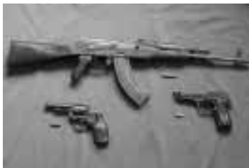
Solo se emplearan para el servicio policial las armas autorizadas

Las armas de fuego y municiones de uso reglamentario en el servicio policial son: revolver calibre 38" de bala de plomo únicamente, y pistolas de calibre 9 mm de proyectil encamisetado. Asimismo, las armas de largo alcance utilizadas son las que emplean munición de calibre 5.56x31, 7.62x39 y 7.62x51. (PB 11a)