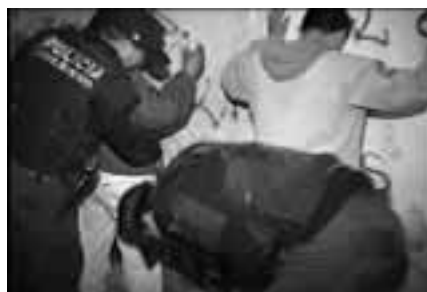
Las intervenciones policiales deben ser legales, en defensa de la sociedad y del Estado.

Para que la Policía Nacional del Perú cumpla sus funciones, se le ha conferido a los policías determinadas facultades, siendo las más importantes, entre otras, el arresto, la detención y el uso de la fuerza.