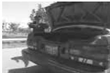
Sea cuidadoso al aperturar la maleta.