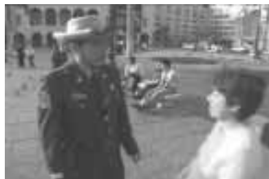
La imagen policial en la sociedad debe concebirse como promotora de la cultura de paz.

Vivir en fraternidad y armonía son los ideales de paz que más se predicán, en contraposición a la guerra y a todo género de conflictos.